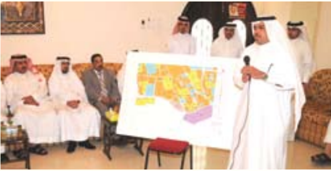
وزير البلديات والزراعة يستعرض المشاريع المستقبلية