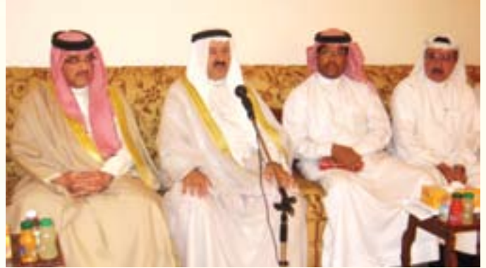
وزير الاسكان يستعرض مع الأهالي المشاريع الاسكانية