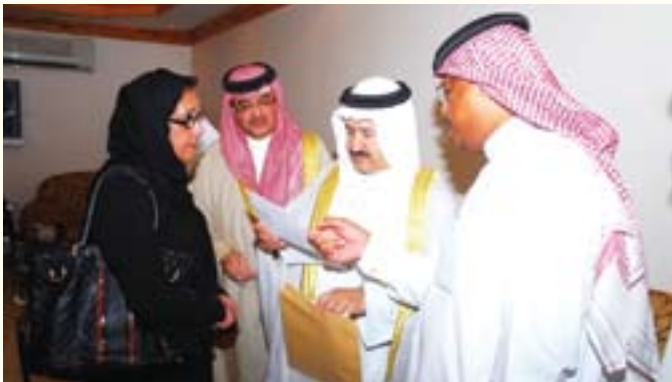
وزير الاسكان يناقش الأهالي عن الخدمات الاسكانية