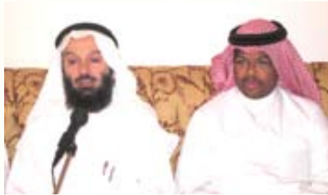
الشيخ عصام إسحاق يلقي محاضرة تربية عن واجب الآباء في تنشئة الأبناء