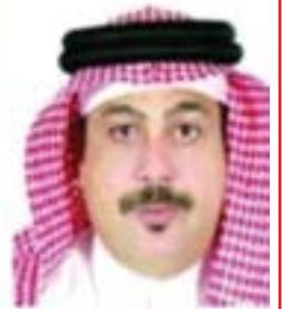
فهي بني حادا

بتنجز أبناء أم الحصم هذه الفرصة السانحة لرفع أسمي أبنان الشكر والتقدير والامتنان والولاء إلى حضرة صاحب الجلالة الملك حمد بن عيسى آل خليفة ملك مملكة البحرين على امتكافا أهالي أم الحصم في لفسر الصافية واستماع جلالته للأهالي وما تقدموا به إلى جلالته من مطالب واحتياجات المنطقة