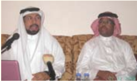
الدكتور صلاح علي النائب الثاني لرئيس مجلس النواب يلقي محاضرة عن مراحل خلق الإنسان