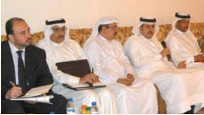
وزير الأشغال يستعرض خدمات الوزارة