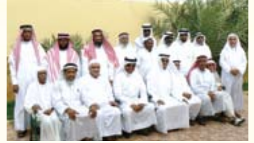
عدد من المشاركين في رحلة التسوق والترفيه لمدينة الدمام