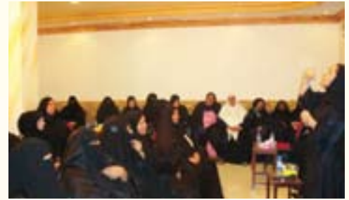
إحدى المحاضرات النسائية ضمن النشاط الصيفي