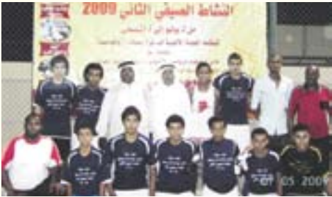
فريق العربي الفائزة ببطولة الناشئين لكرة القدم