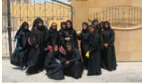
لجنة فتيات الدائرة ضمن النشاط الصيفي