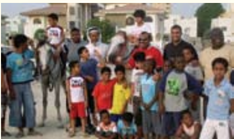
عدد من المشاركين في برنامج تدريب ركوب الخيل