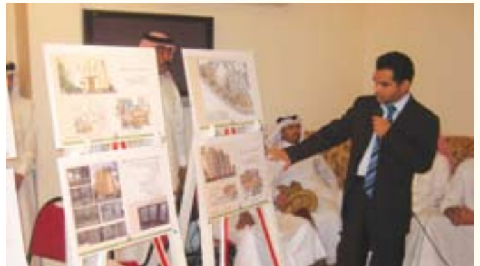
أحد مسؤولي وزارة الاسكان يستعرض المشاريع الاسكانية

تنفيذاً لتوجيهات حضرة صاحب الجلالة الملك حمد بن عيسى آل خليفة عاهل البلاد المفدى حفظه الله ورعاه قام معالي الشيخ ابراهيم بن خليفة آل خليفة وزير الاسكان وعدداً من كبار المسؤولين في الوزارة بالالتقاء بأهالي أم الحصم في مجلس النائب عبدالرحمن بومجيد لبحث احتياجات ومطالب الأهالي فيها وتأتي هذه الزيارة لإعداد تقرير متكامل بشأن هذه الاحتياجات ليتم رفعه لجلالة الملك المفدى