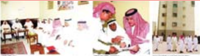
بومجيد غير من أمته بتحويل الأراضي للتراث إلى وحدات مكتبية .. مناقشة الجلسة