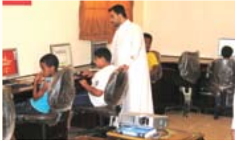
عدد من المشاركين برنامج تدريب الحاسب الآلي