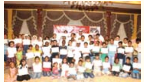
تكريم المشاركين في برنامج تدريب الحاسب الآلي وتعليم السباحة