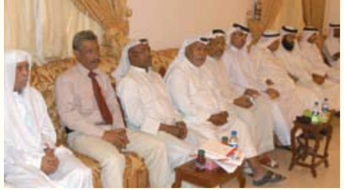
جانب من أهالي أم الحصم في مجلس بومجيد