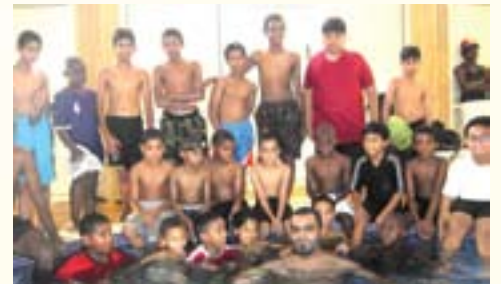
عدد من المشاركين في برنامج تعليم السباحة