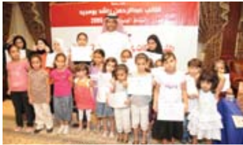
تكريم المشاركين في برنامج تحفيظ القرآن الكريم