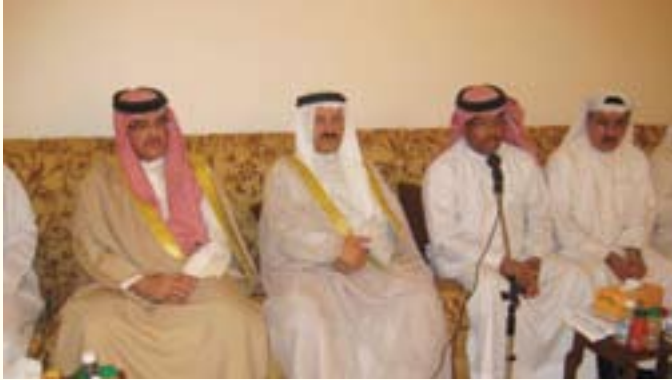
النائب بومجيد يستعرض الاحتياجات الاسكانية للمنطقة