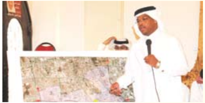
النائب عبدالرحمن بومجيد يستعرض احتياجات المنطقة