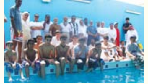
عدد من المشاركين في احدى الرحلات الترفيهية