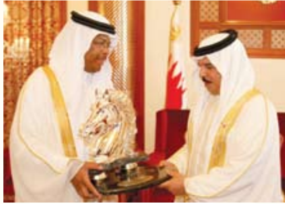
جلالة الملك يتلقى هدية تذكارية من النائب عبدالرحمن راشد بومجيد