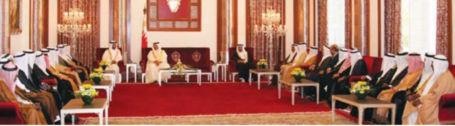
جلالة الملك يلتقي بوفد من أهالي منطقة أم الحصم في يوم الخميس الموافق ٤ يونيو ٢٠٠٩ بقصر الصافية