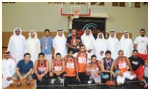
النائب بومجيد يتوج فريق الحالة ببطولة كرة السلة