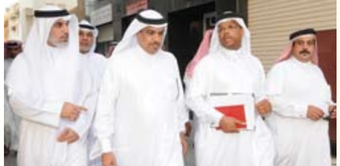
وزير البلديات والنائب عبدالرحمن بومجيد والأهالي في جولة بالمنطقة