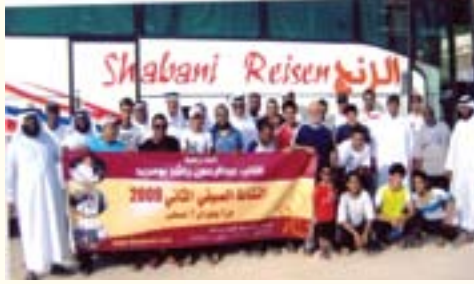
اللجنة المنظمة تسير رحلة للعمرة