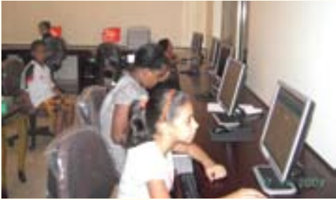
عدد من المشاركين برنامج تدريب الحاسب الآلي