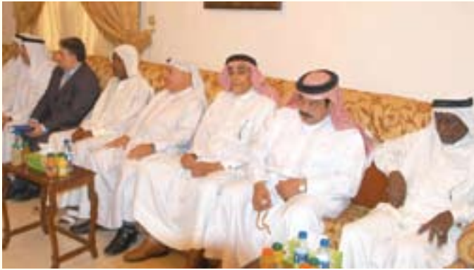
جانب من أهالي أم الحصم في مجلس بومجيد