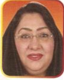
سعادة النائب لطيفة محمد القعود