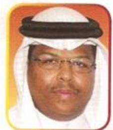
سعادة النائب عبدالرحمن راشد بومجيد