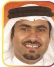
سعادة النائب عادل عبدالرحمن العسومي