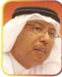
سعادة النائب حسن سالم الدوسري